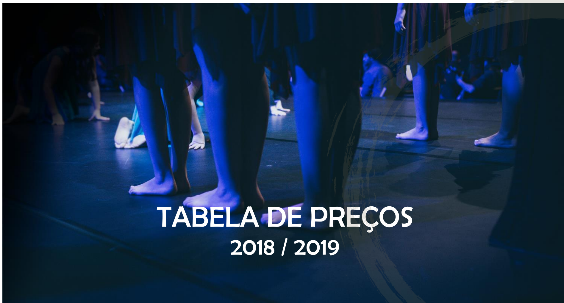
TABELA DE PREÇOS 2018 / 2019